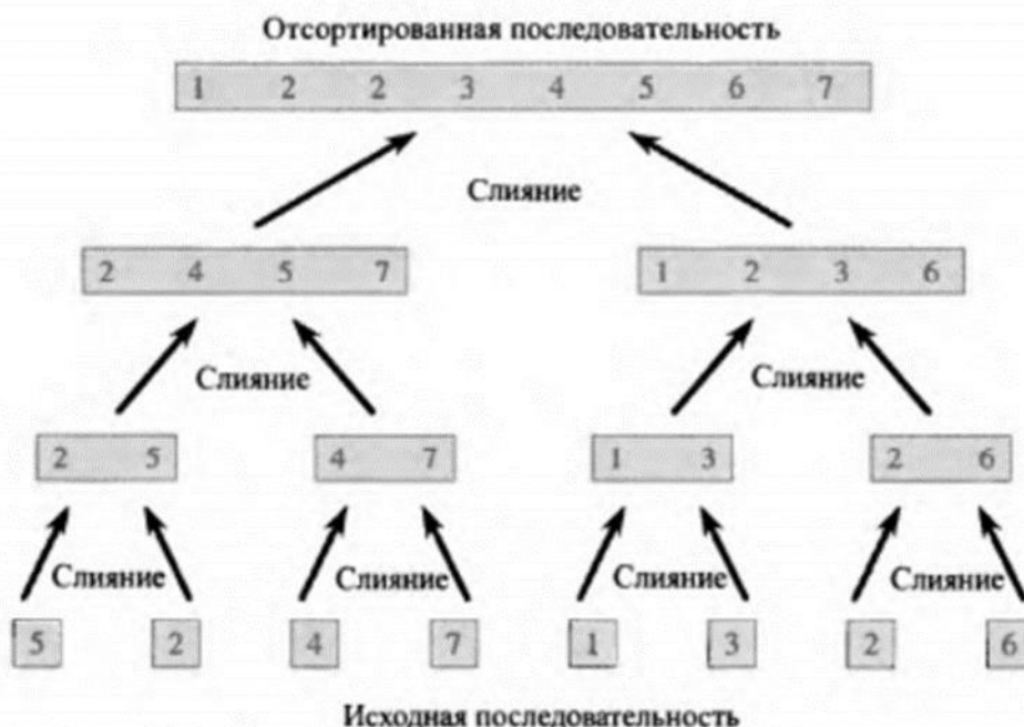
Рис. 2.4. Процесс сортировки слиянием массива A = \langle 5, 2, 4, 7, 1, 3, 2, 6 \rangle . Длины подлежащих слиянию отсортированных последовательностей возрастают в ходе работы алгоритма.