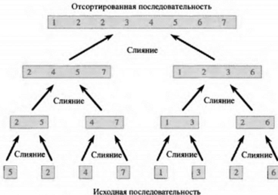
Рис. 2.4. Процесс сортировки слиянием массива A = \langle 5, 2, 4, 7, 1, 3, 2, 6 \rangle . Длины подлежащих слиянию отсортированных последовательностей возрастают в ходе работы алгоритма.

1) Используя в качестве образца рис 2.4, проиллюстрируйте работу алгоритма сортировки слиянием для массива A = \langle 3, 4, 1, 5, 2, 6, 3, 8, 5, 7, 9, 4, 9 \rangle .