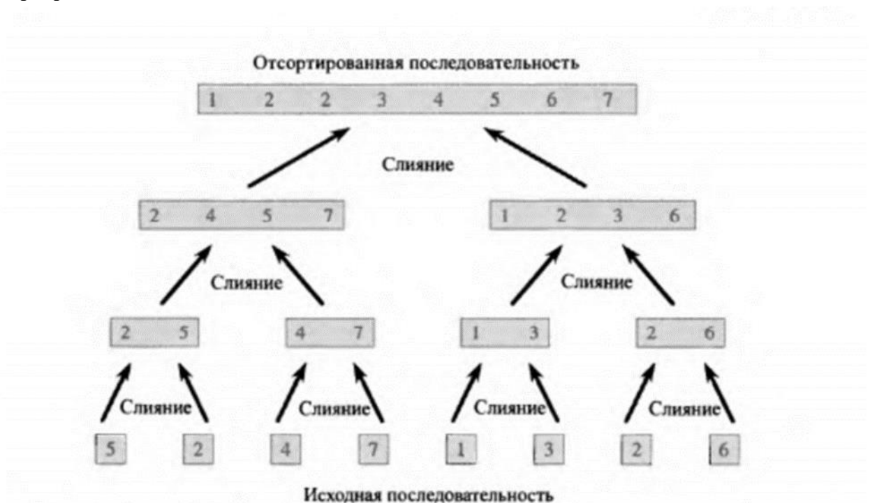
Рис. 2.4. Процесс сортировки слиянием массива A = \langle 5, 2, 4, 7, 1, 3, 2, 6 \rangle . Длины подлежащих слиянию отсортированных последовательностей возрастают в ходе работы алгоритма.