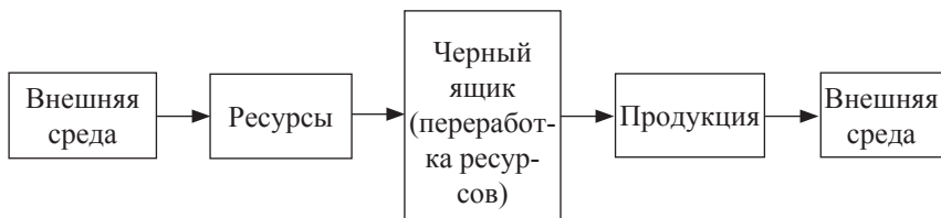
Рис. 2. Процесс производства товара

То, что происходит в самом отраслевом «чёрном ящике», является внутренней средой, обеспечивающей процесс переработки ресурсов в конечный продукт. Можно предположить, что ресурсы, используемые в этом процессе, определяют тип и вид производимого товара (или в более широком книговедческом смысле – предмет, цель и адрес продукции).