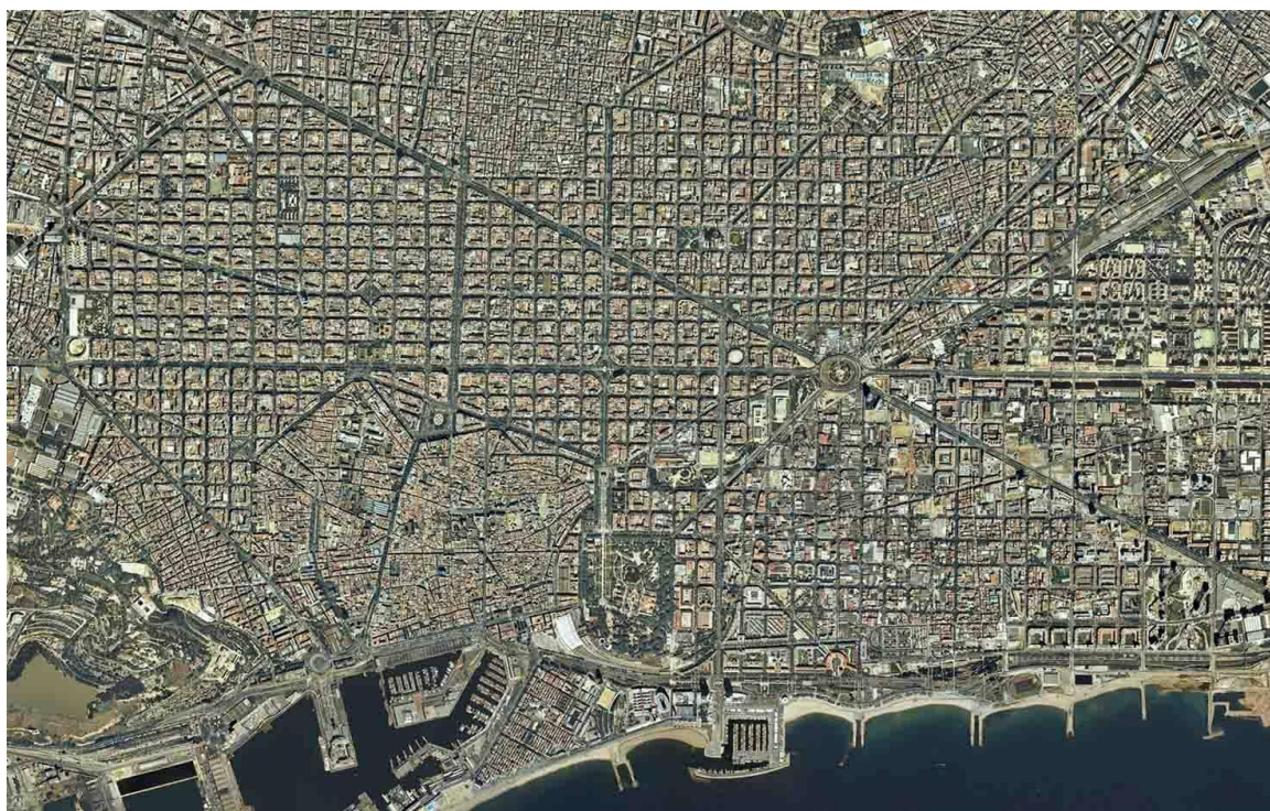
Рис. 4. Градостроительный план Барселоны

Не во всех городах центром служила площадь. Для Испании, к примеру, центром было улица, а тип социальных отношений можно прочесть по способу проектирования улиц. Если посмотреть на градостроительный план Барселоны «рис. 3», можно увидеть чётко очерченную сетку прямых городских улиц (план Эшампле) — такое проектирование называют регулярным, прямые улицы отражают осознанность и последовательность политики развития города, определённую и строгость норм, правил и законов. В то время как обилие извилистых хаотичных улиц говорят об обратном – беспорядочности социального устройства, неконтролируемости социальных процессов, нестабильности общества.