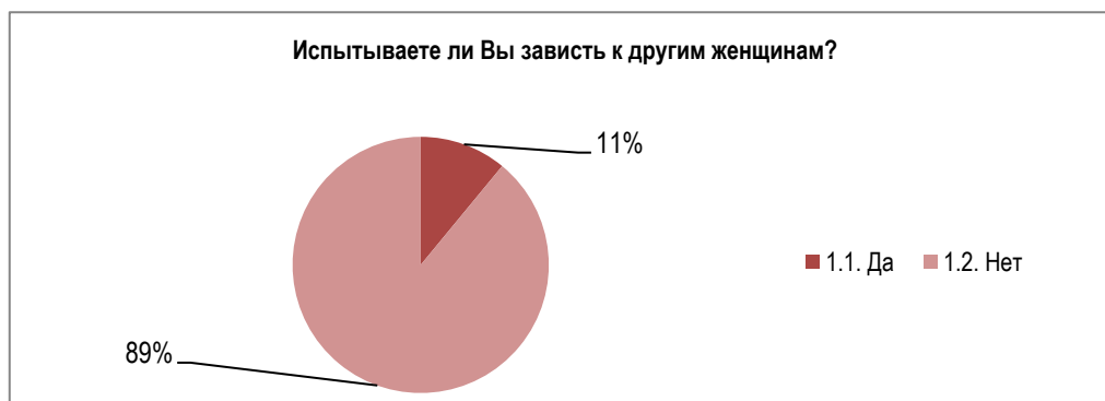
Рисунок 1 - Иллюстрация ответов респондентов на вопрос «Испытываете ли Вы зависть к другим женщинам?»

На вопрос «Испытываете ли Вы зависть к другим женщинам?» 89% опрошенных ответили отрицательно, 11% дали положительный ответ.