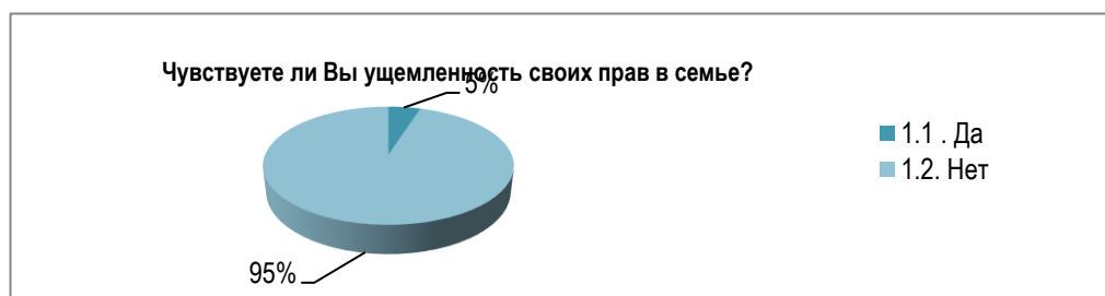
Рисунок 2 – Иллюстрация ответов респондентов на вопрос «Чувствуете ли Вы ущемленность своих прав в семье?»

Среди объектов зависти у ответивших можно выделить следующие: материальный доход (41%), внешний вид (23%), автомобиль (18%), квартира (14%), статус (4%).