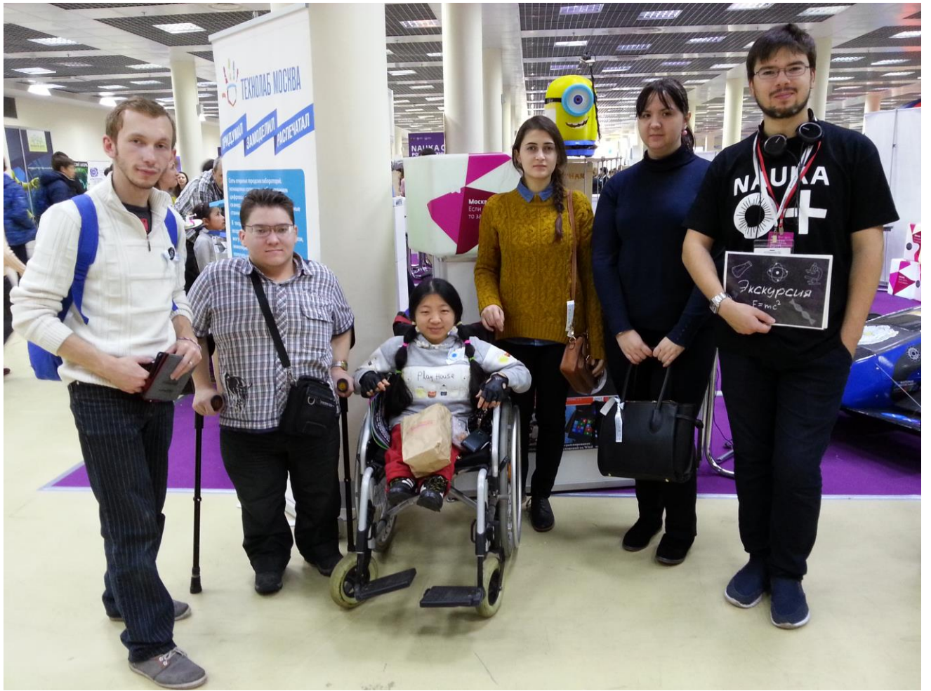
Участники Фестиваля науки 2015