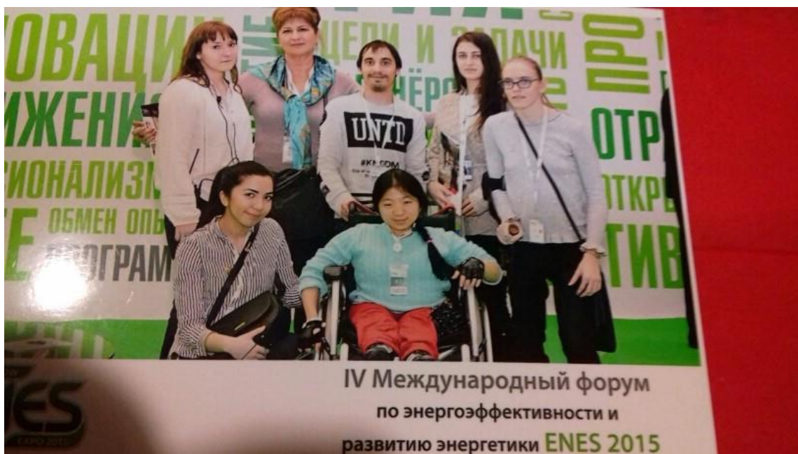
Команда ФЭ МГТЭУ на Форуме