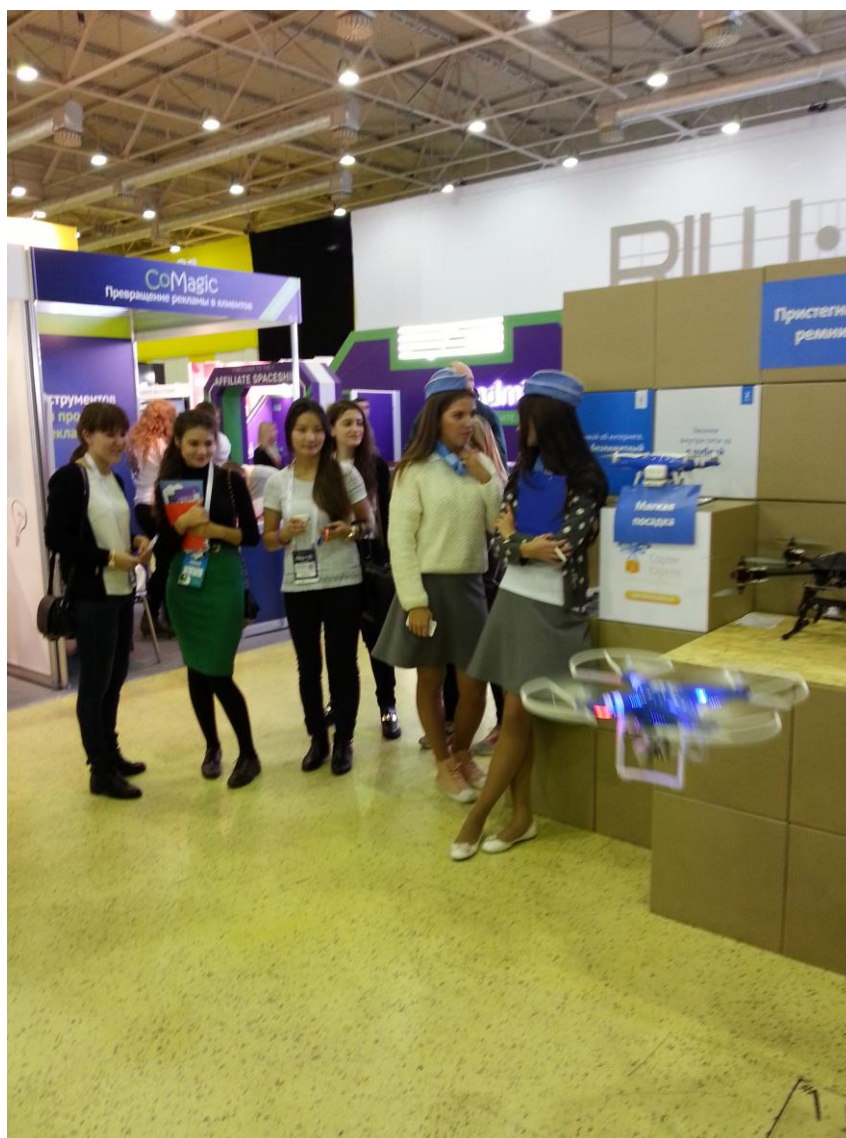
На выставке RIW-2015