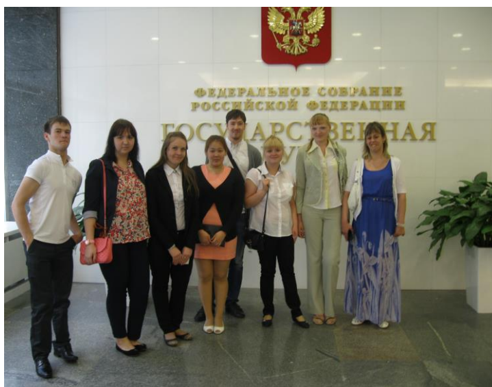
Среди участников круглого стола в Государственной Думе РФ