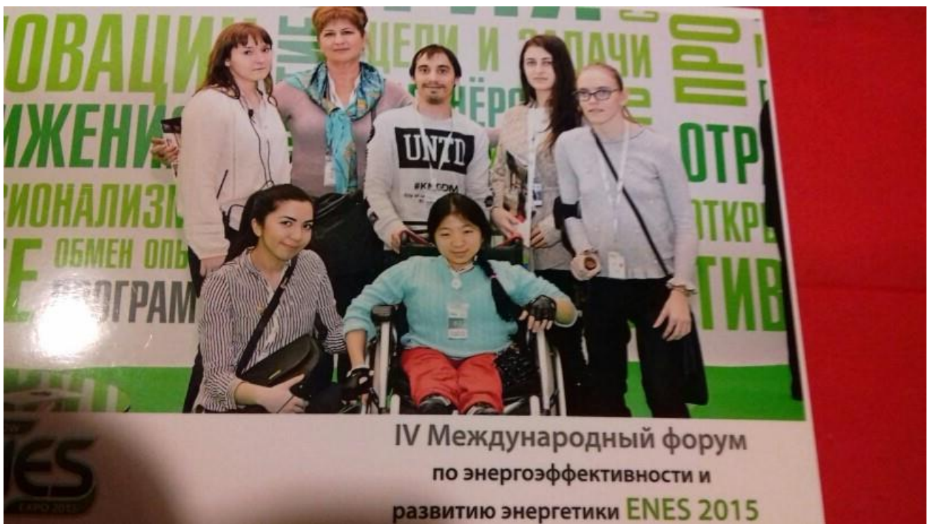
Среди участников Форума «Moscow ENES expo 2015 Энергоэффективность и развитие энергетики»