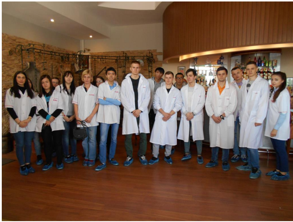
На Очаковском заводе