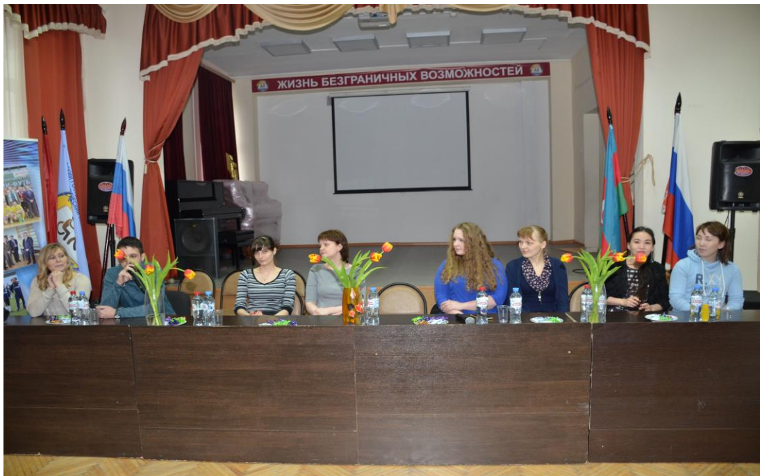
Встреча со студентами младших курсов