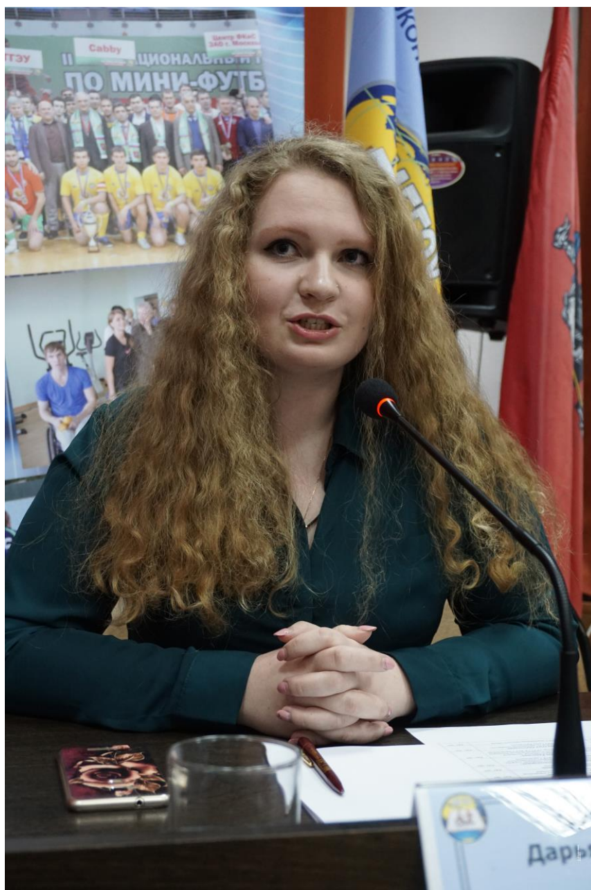
Круглый стол «Профессиональная ориентация и трудоустройство молодых инвалидов»