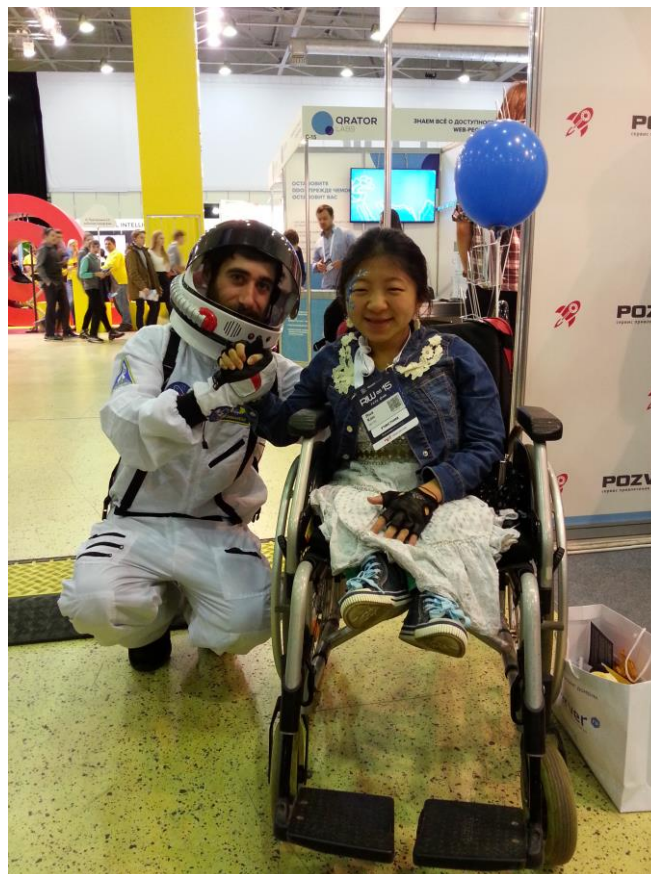
На выставке «RIW 2015»