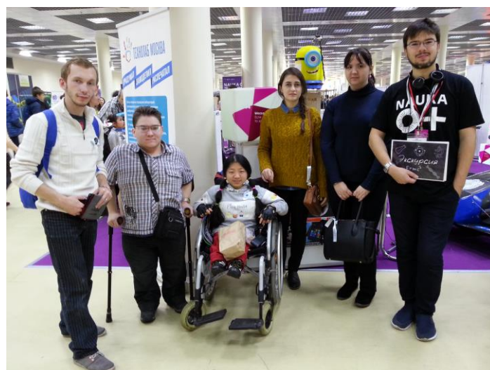
Участники Фестиваля науки