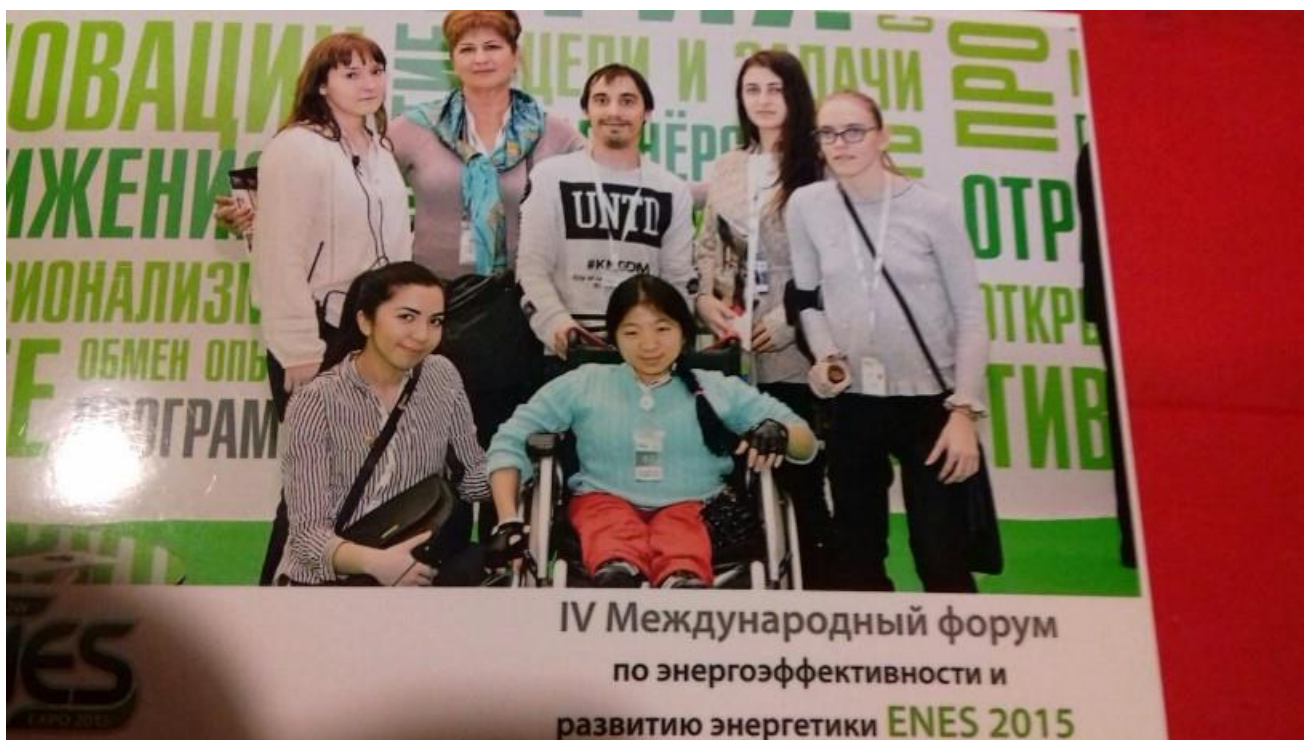
Среди участников Форума «Moscow ENES expo 2015 Энергоэффективность и развитие энергетики»