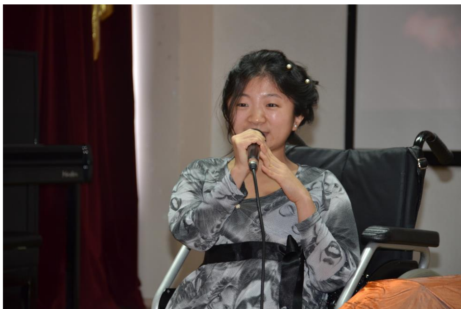
Концерт, посвященный 8 марта (2015 г.)