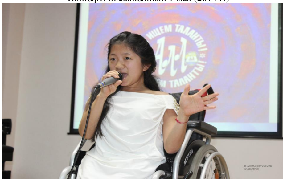
Конкурс «Алло, мы ищем таланты», 2015 г.