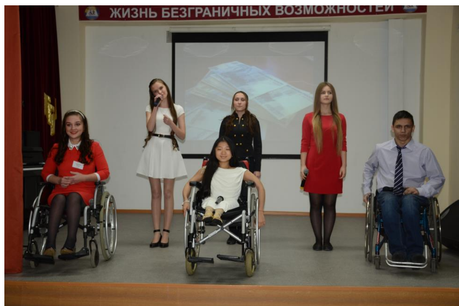
Концерт, посвященный 25-ти летнему юбилею МГГЭУ