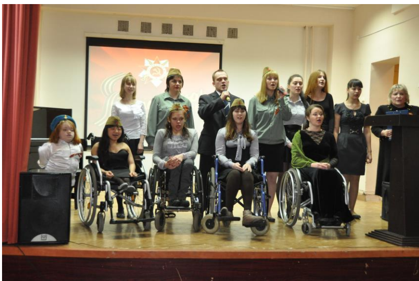
Концерт, посвященный 9 мая (2014 г.)