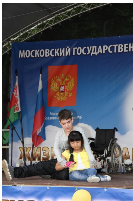
Фестиваль «Жизнь безграничных возможностей»