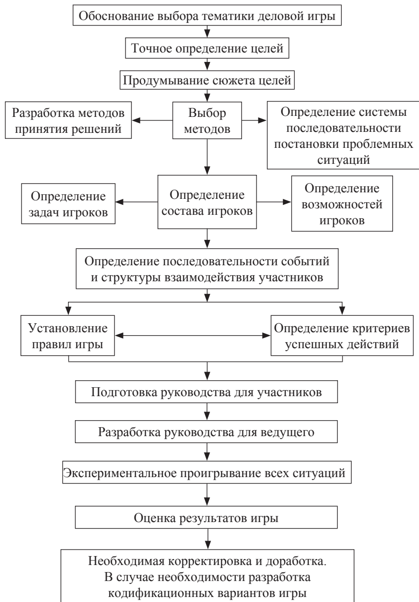
Рис. 1.1. Принципы разработки деловых игр