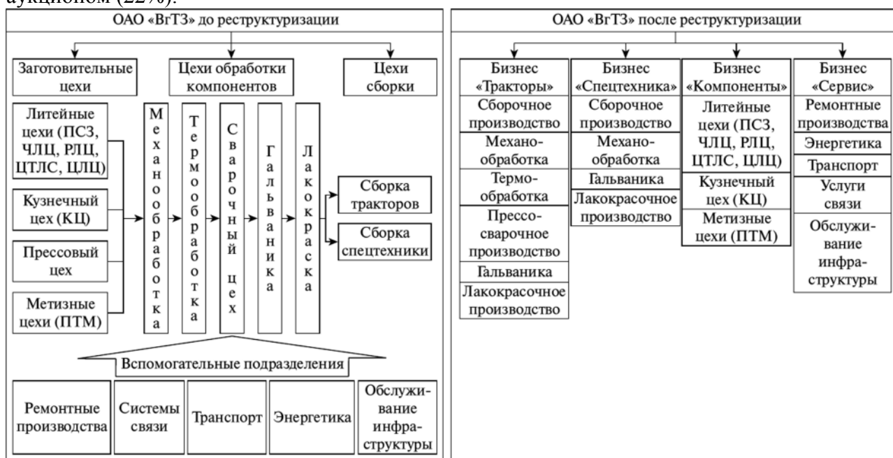
Рис. Структура ОАО «Волгоградский тракторный завод» до и после реструктуризации

Завод сантехнического оборудования был образован как часть строительного объединения в секторе жилищного строительства и отвечал за монтажные услуги. В 1994 году завод был преобразован в открытое акционерное общество на основе отделения от исходного предприятия. Акционерный капитал был распределен между работниками (40%), трастовыми компаниями и инвестиционными фондами (25%), фондом государственного имущества (10%), частными акционерами (3%) и сертификатным аукционом (22%).