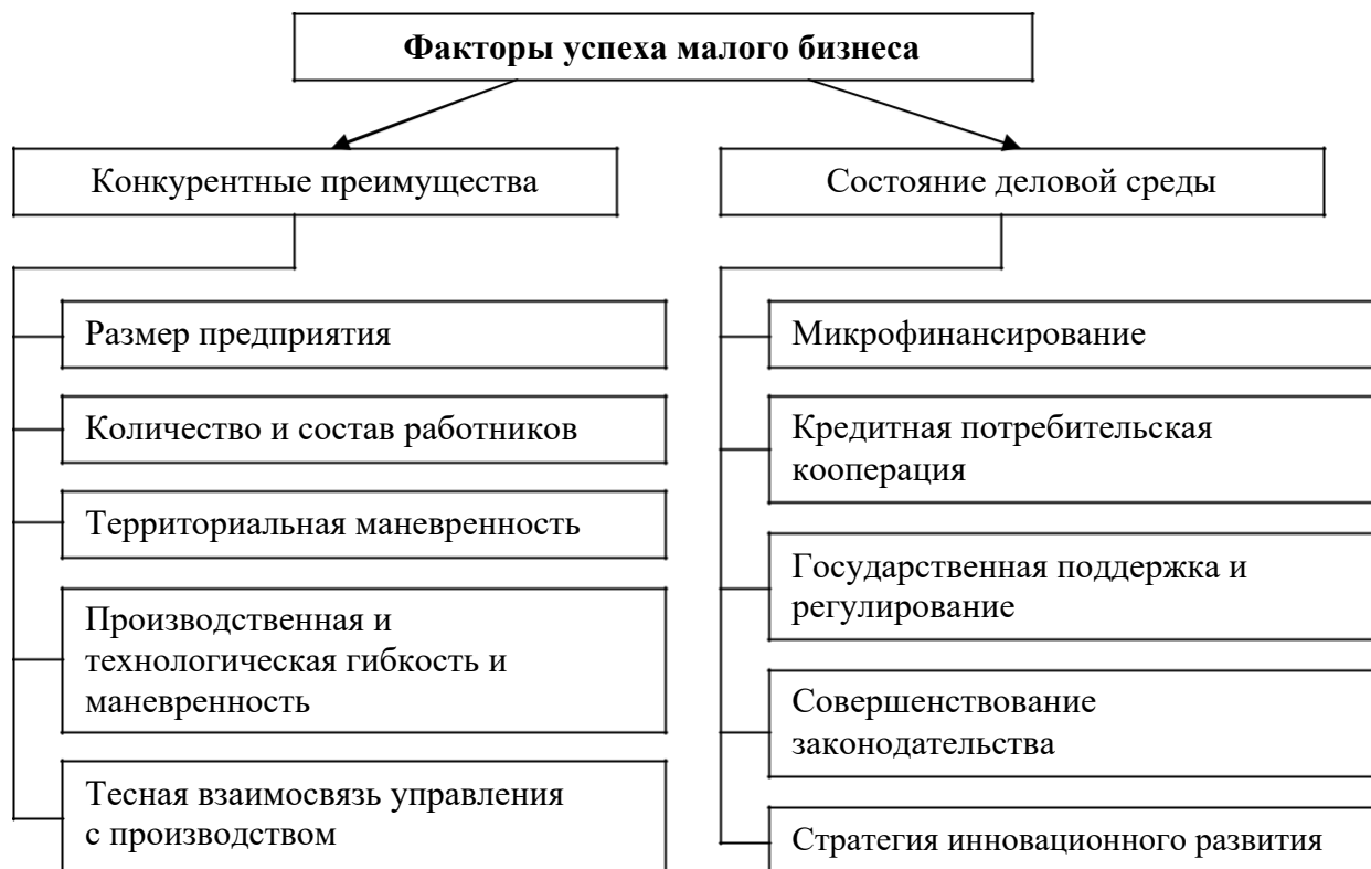
Рис. 1. Факторы успеха малого бизнеса