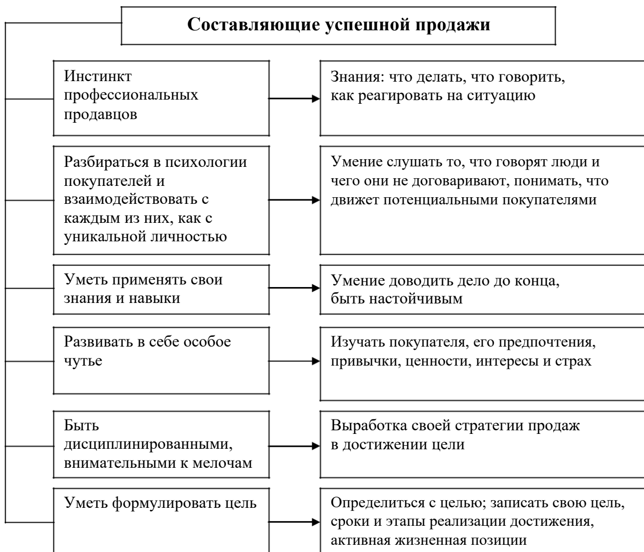
Рис. 2. Составляющие успешной продажи

Используя эти факторы, важно представить основные составляющие успешной продажи (рис. 2).