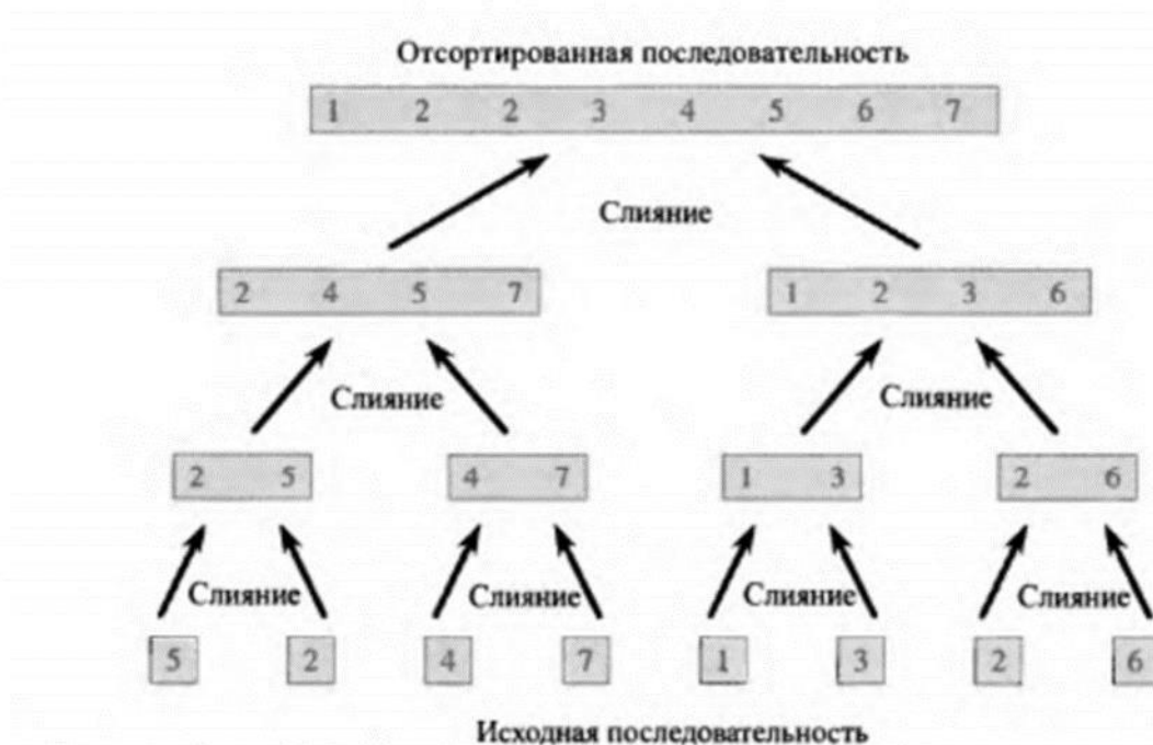
Рис. 2.4. Процесс сортировки слиянием массива A = \langle 5, 2, 4, 7, 1, 3, 2, 6 \rangle . Длины подлежащих слиянию отсортированных последовательностей возрастают в ходе работы алгоритма.